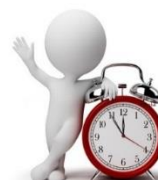
Date & Durée

Référents handicap, RH, médecins du travail ou toute autre personne en charge de la politique handicap de sa structure